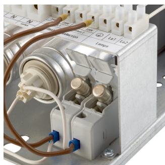
Svorkovnice předřadnikové skříně ECB330