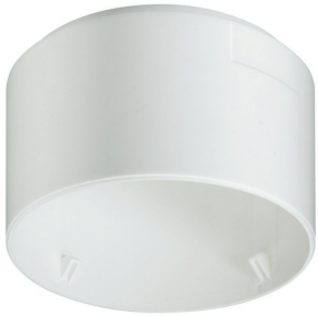
LRH2070/00 SURFACE BOX