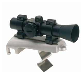
Zařízení pro přesné zaměření