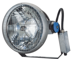
MVF403 - MASTER MHN-LA - 1000 W