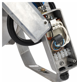
Přípojná skříňka s e-zapalovačem