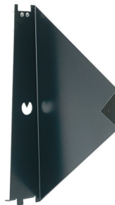
Simple aiming device